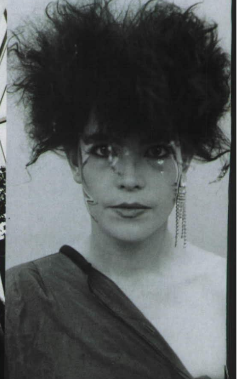
Sabine von Oettingen'in 80'lerdeki tasarımları bugün müzede saklanıyor.