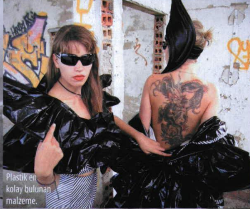
Plastik en kolay bulunan malzeme.