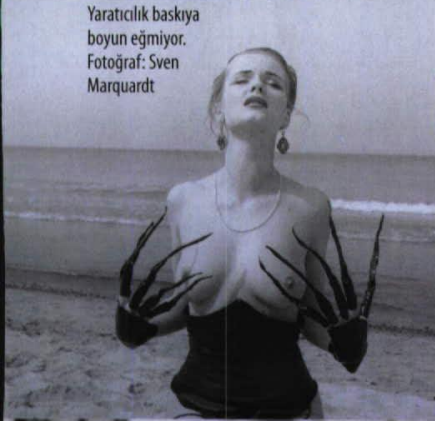
Yaratıcılık baskıya boyun eğmiyor.